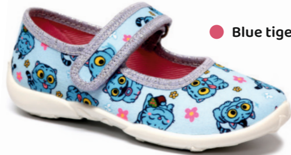
● Blue tiger