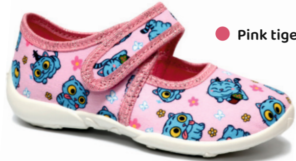
● Pink tiger