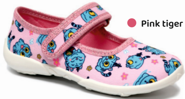
● Pink tiger