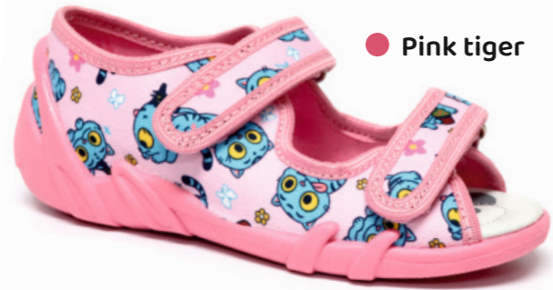
● Pink tiger