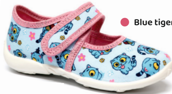
● Blue tiger