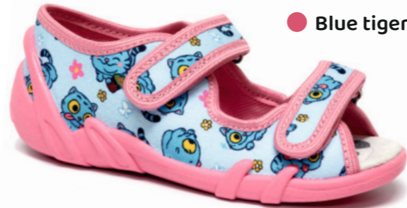
● Blue tiger