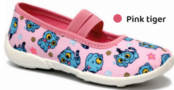
● Pink tiger